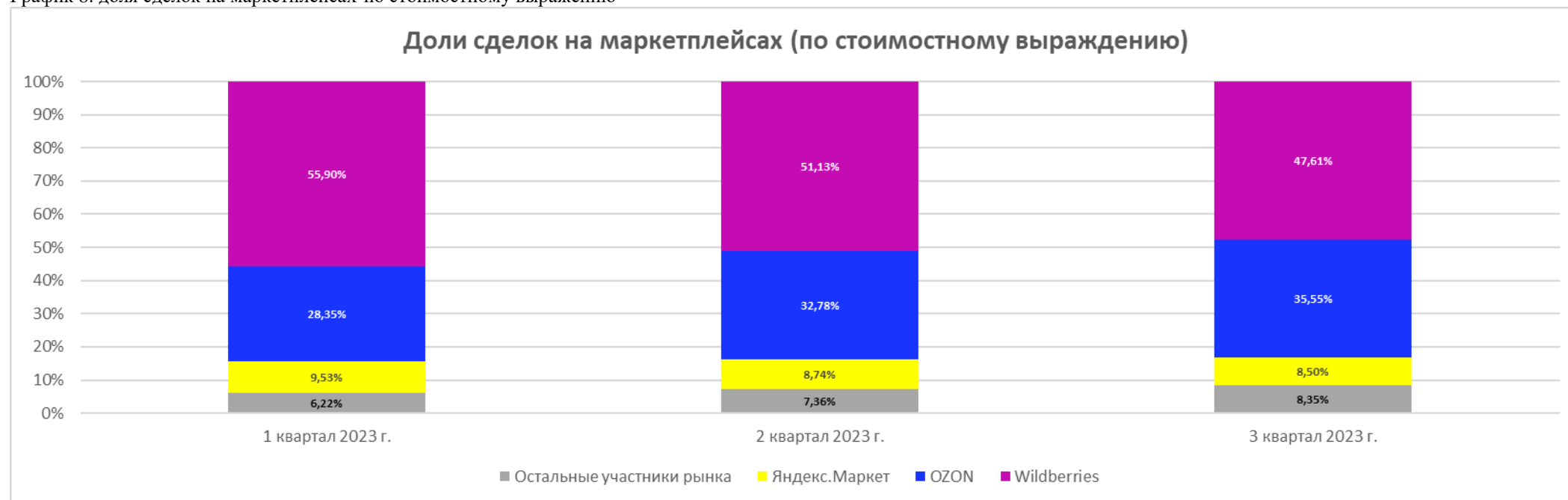
График 8: доля сделок на маркетплейсах по стоимостному выражению